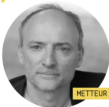
METTEUR EN SCÈNE