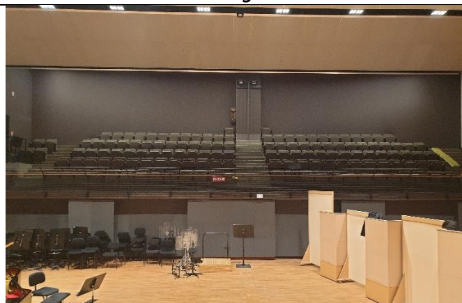
Gradins pour l'accueil du public