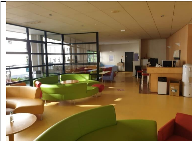
Foyer des musiciens

- au 1 er étage se trouve le foyer des musiciens (salle de repos et de restauration), la bibliothèque , et le studio d'enregistrement.