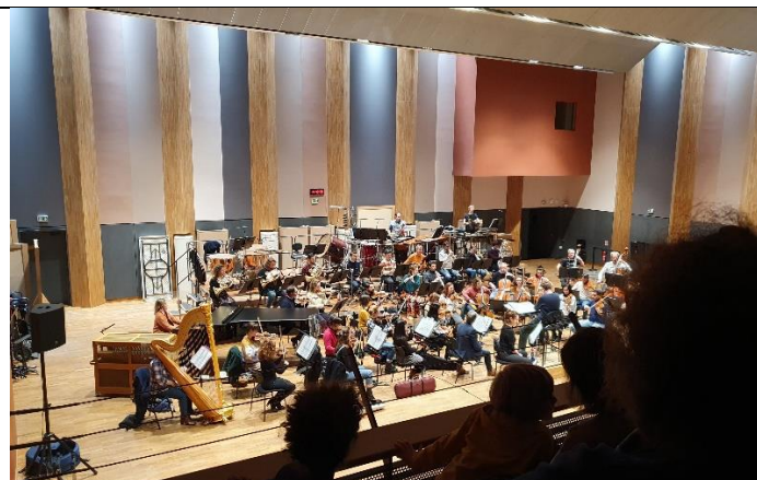
Une répétition en grande salle