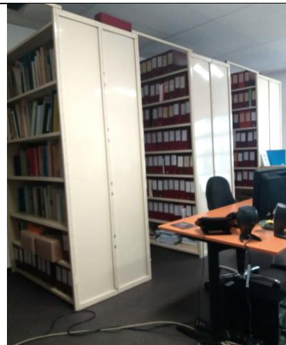
Bibliothèque : les partitions

- le 2 e étage héberge les bureaux de l'administration.