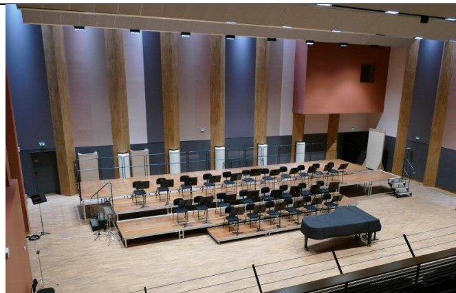
Plateau de la grande salle

La grande salle est reliée au studio d'enregistrement (on observe la lucarne de contrôle en haut à droite des photos), elle est utilisée pour enregistrer des disques ou des musiques de films.