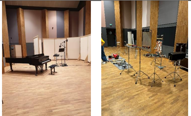
Enregistrement / atelier pédagogique, en salle cordes

Salle cordes : acoustique la plus résonnante , on y distingue bien tous les sons, elle est adaptée au travail des cordes, et aux enregistrements. Elle a une capacité de 60 personnes. Il n'y a aucun matériau absorbant dans sa construction, mais plutôt des panneaux réflecteurs (bois). On peut y réaliser des captations, elle est reliée au studio d'enregistrement.