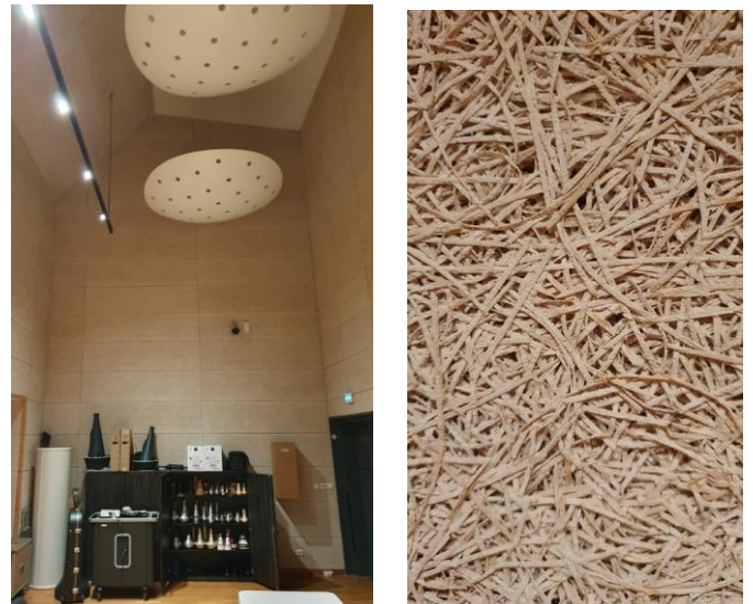
Salle harmonie et son matériau mural

Salle percussions : acoustique la plus sèche des 3 salles, elle est totalement insonorisée . Même constitution que la salle harmonie, mais avec un plafond plus bas. Les percussionnistes peuvent travailler sans déranger personne.