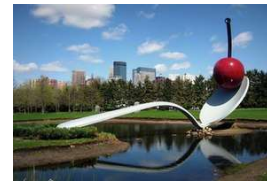
« Spoonbridge and Cherry Oldenburg », Claes Oldenburg et Coosje van Bruggen