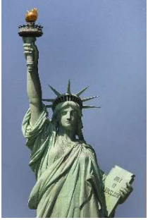
La Statue de la Liberté A. Bartholdi