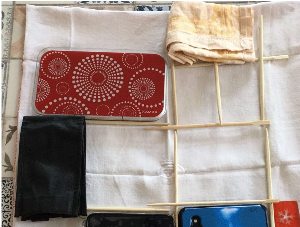
Revisité par Louise