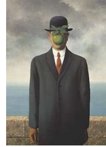
Le Fils de l'Homme- R Magritte