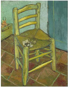
« La chaise » de V. Van Gogh