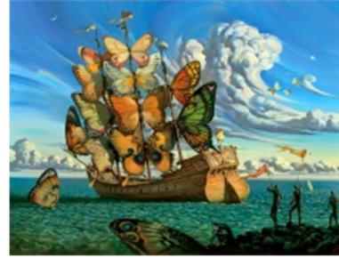
« Le départ du bateau ailé » ou « le bateau à voile papillon » de Salvador Dali