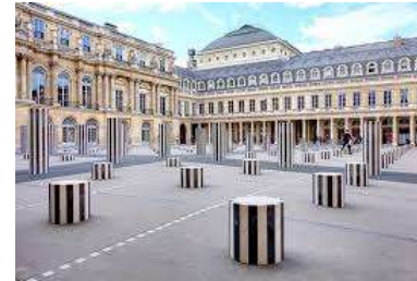
Les colonnes de Buren