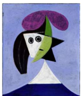
Femme au chapeau, P Picasso