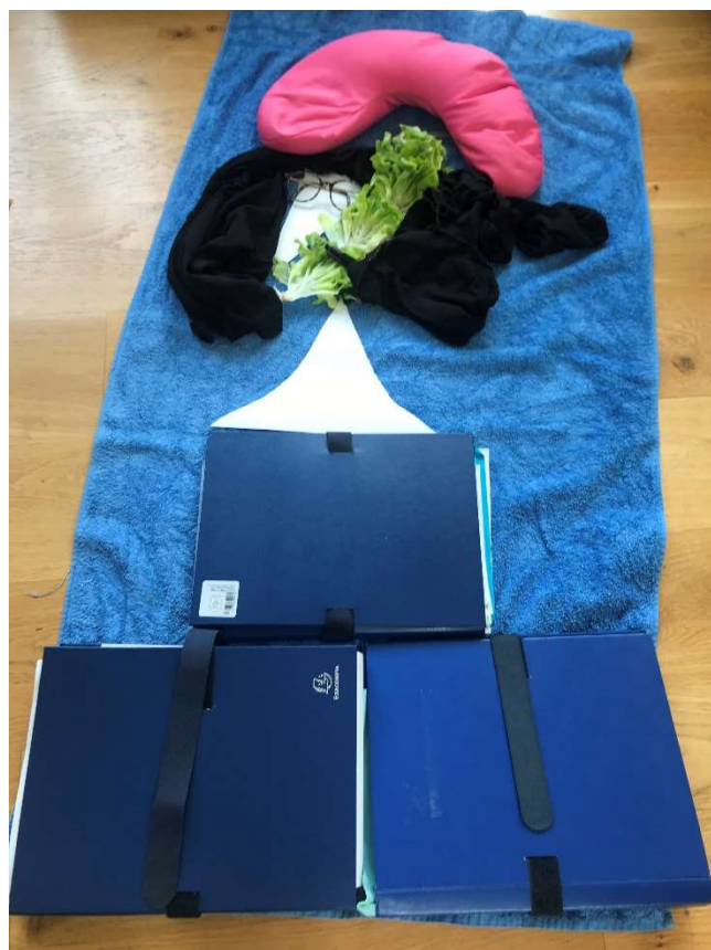
Revisité par Léo