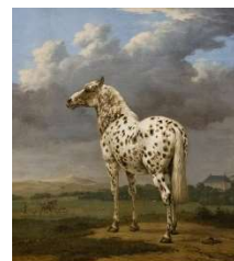
Le cheval de pie - Paulus Potter