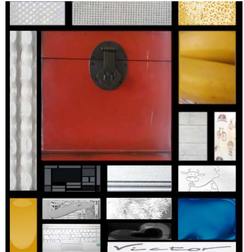
Confiné chez Victor