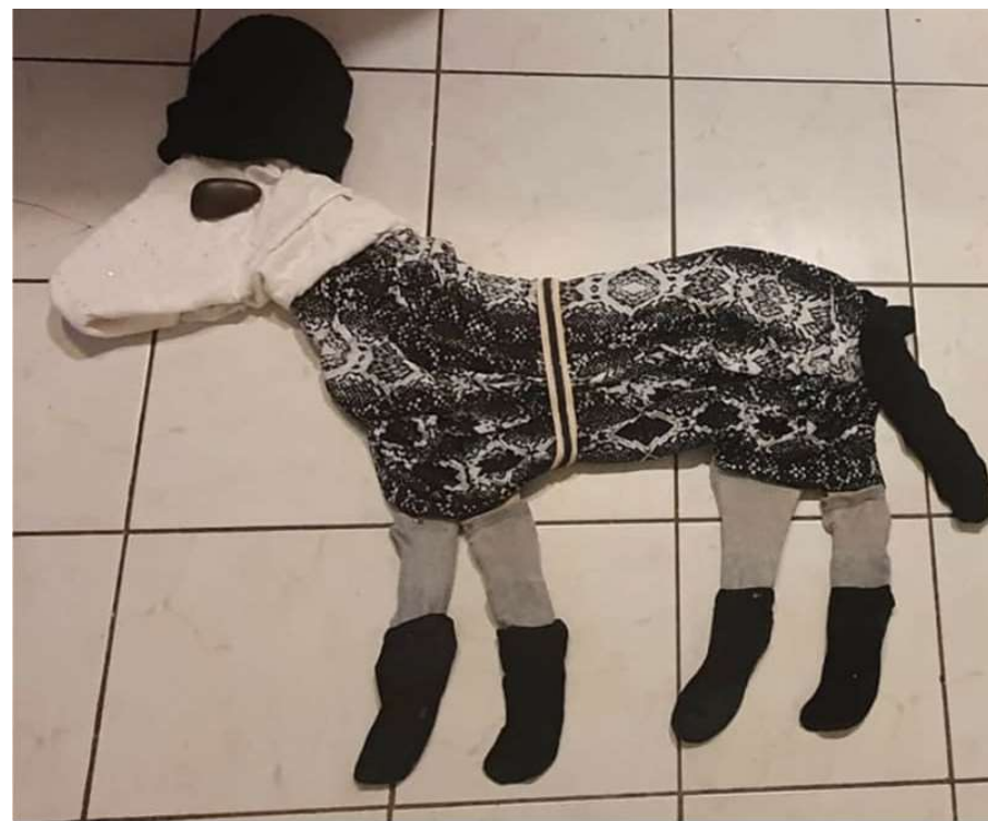
Revisitées par Yassine