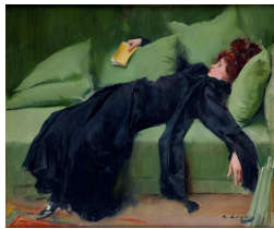
« Joven decadente », jeune décadente de Ramon Casas