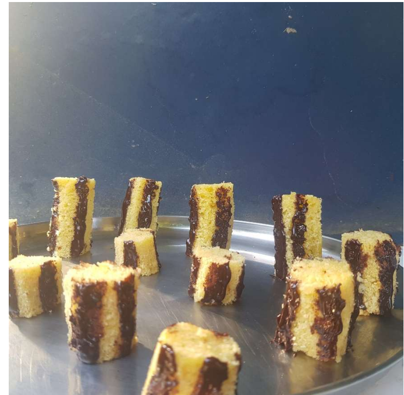
Revisitées par Alaïs

Défi Histoire des Arts « Des classiques de la peinture revisités » Mai 2020