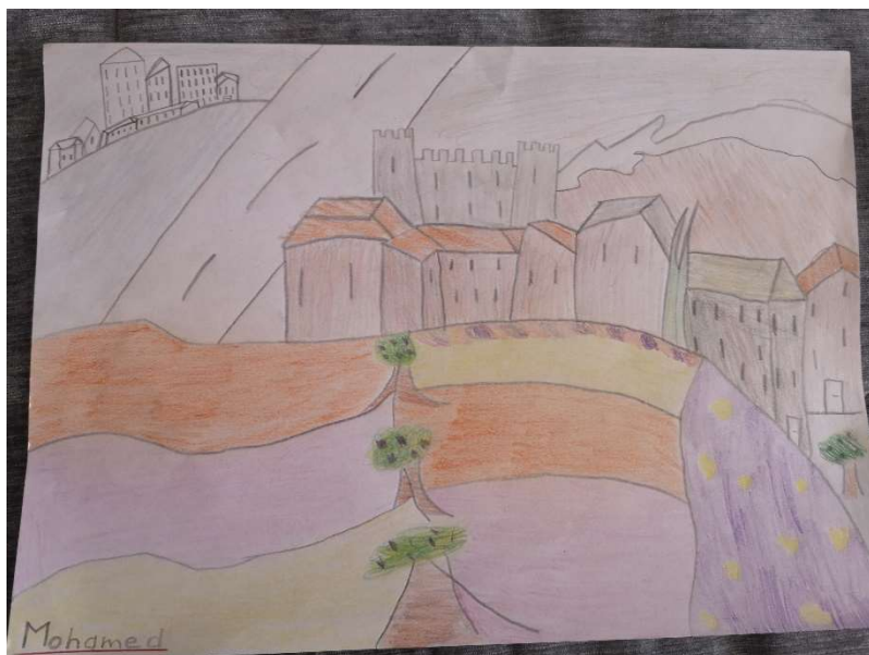
Revisitée par Ivan