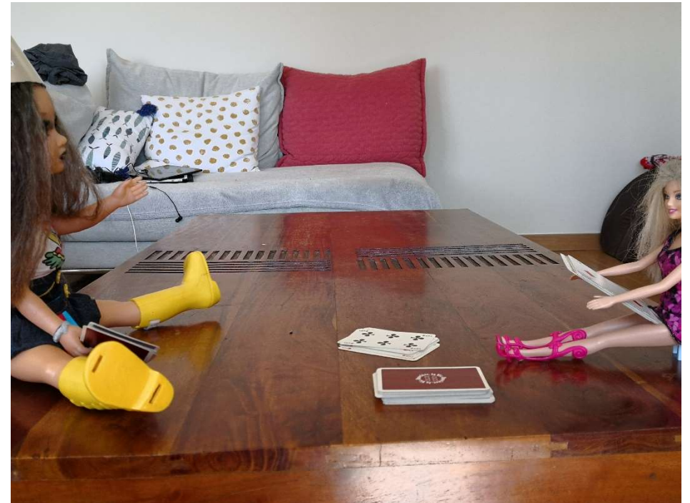
Revisitées par Reekia