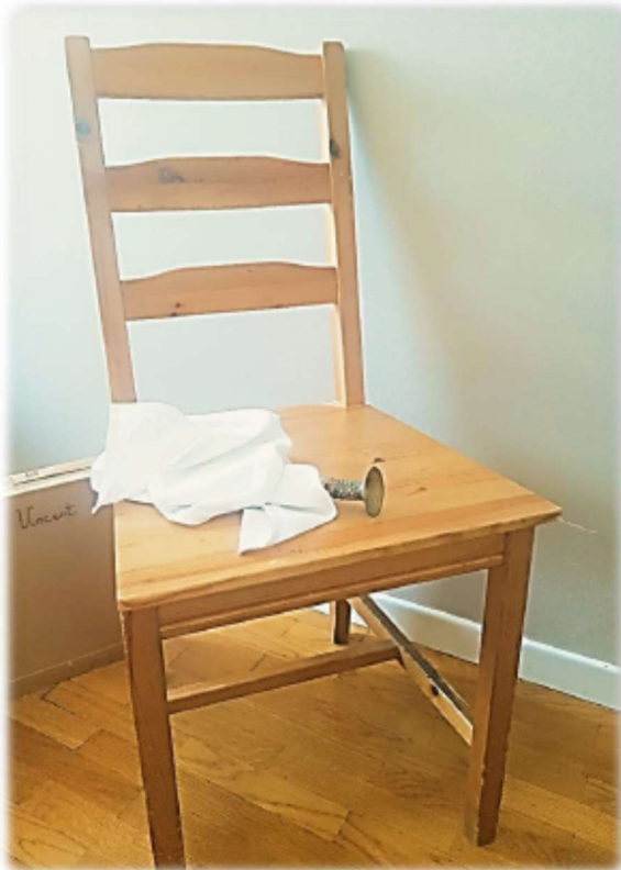
Revisitée par Nail