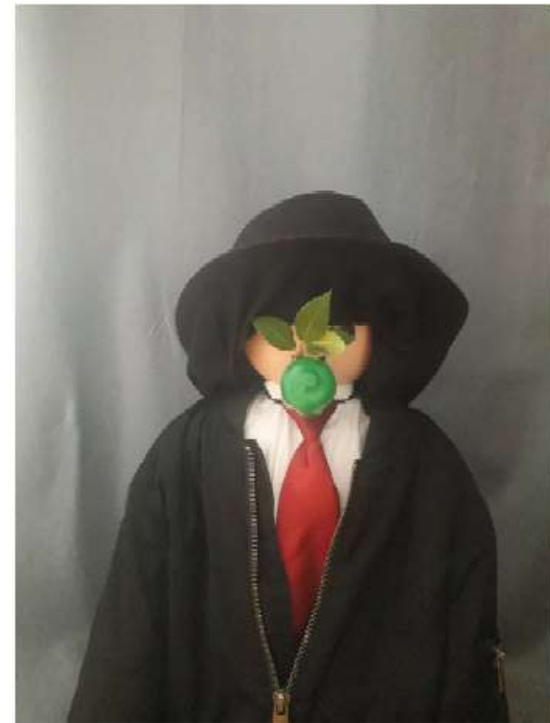
Revisité par Eloane