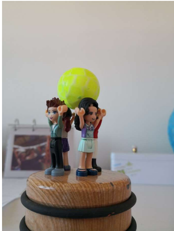
Revisitées par Reekia