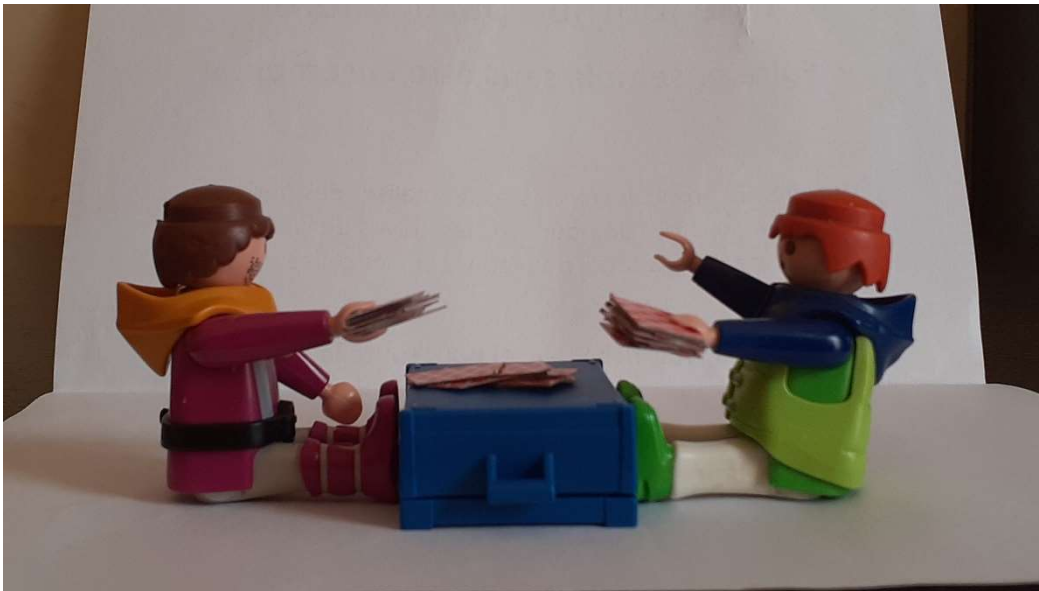
Revisités par Imen