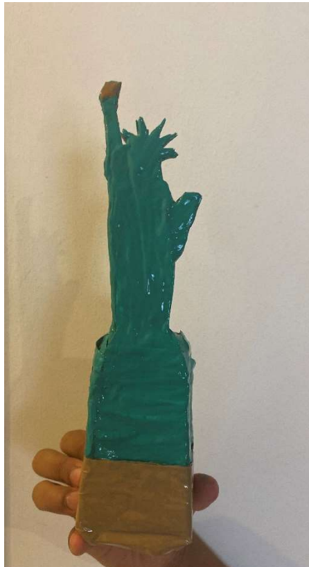
Revisitée par Ivan