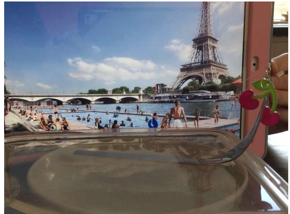
Revisité par Louise