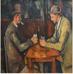
« Les Joueurs de cartes », de Paul Cézanne