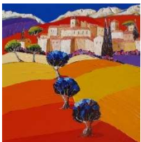
Le temps des cigales Julie Pioch