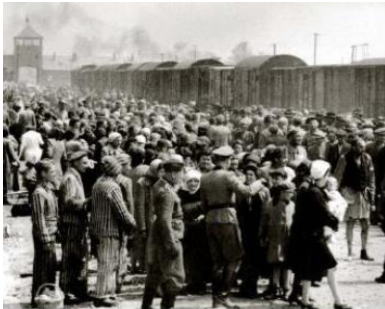
Arrivée de Juifs au camp d'Auschwitz, Pologne, 1944

Le camp d'Auschwitz, situé à 60 km de Cracovie, dans la Pologne occupée, a été ouvert par les nazis en mai 1940 et libéré en janvier 1945 par l'armée soviétique; Il comprenait plusieurs camps dont un pour les exterminations immédiates dans les chambres à gaz. Presque 1 million de juifs et 21 000 tsiganes y sont morts mais aussi environ 70000 Polonais, 15 000 prisonniers de guerre soviétiques et 10 000 prisonniers de divers pays.