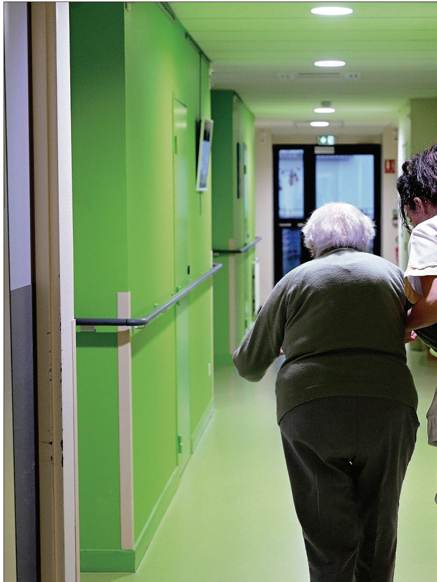
EHPAD. Des résidents de plus en plus vieux, qui arrivent de plus en plus tard en Ehpad, avec des pathologies de plus en plus lourdes. C'est grosso modo le profil des personnes âgées prises en charge dans l'Allier.

■ Comment les personnels soignants vivent-ils leurs conditions de travail ? Les deux conseillères départementales parlent clairement d'un état d'épuise-