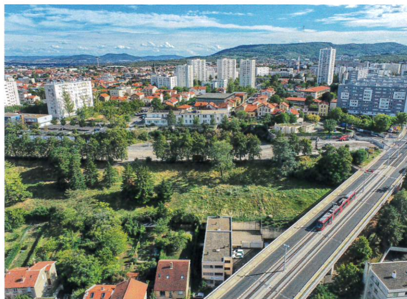
Site de projet.