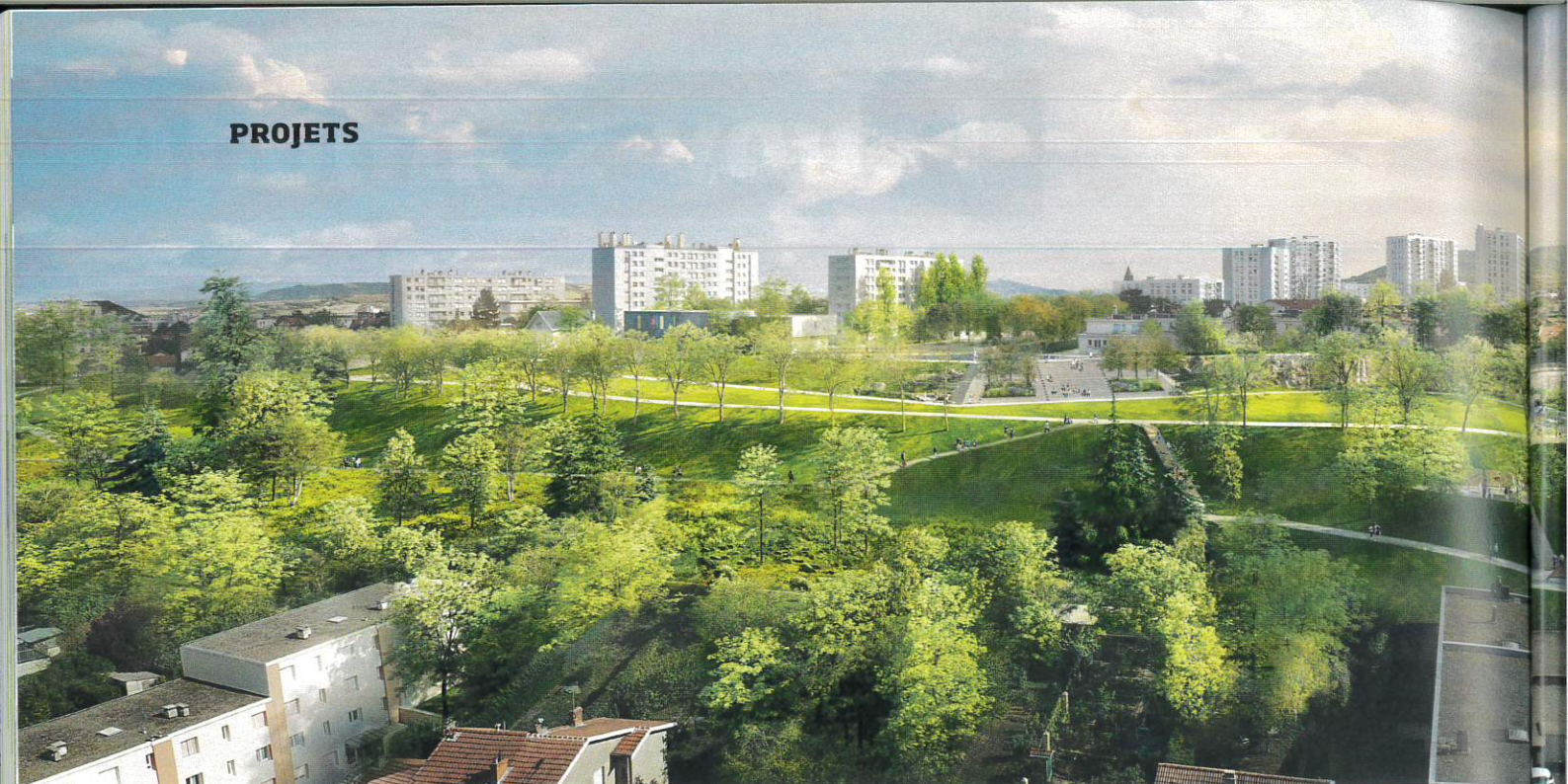
Perspective de la phase 1.