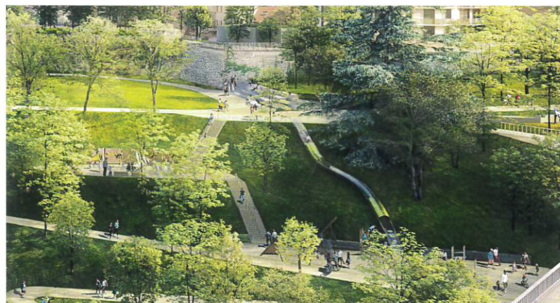
Aire de jeux.

Le coût estimatif de l'opération s'élève à 9,6 millions d'euros hors taxes dont 7 millions d'euros pris en charge par Clermont Auvergne Métropole et 2,6 millions d'euros par la Ville de Clermont-Ferrand. Une première phase sera livrée en 2026, la livraison définitive étant prévue pour 2028.