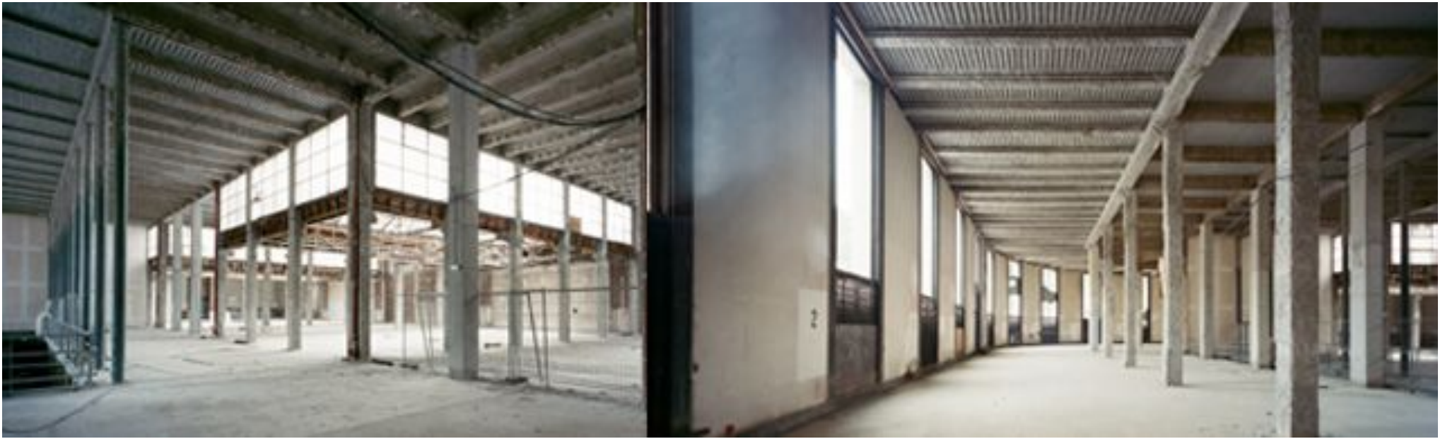
Les sous-sols du Palais de Tokyo