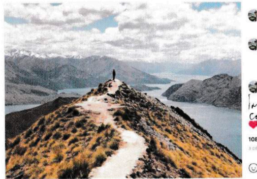
Capture d'écran : anonyme, photographie prise lors d'une randonnée, site @Instagram (détail).