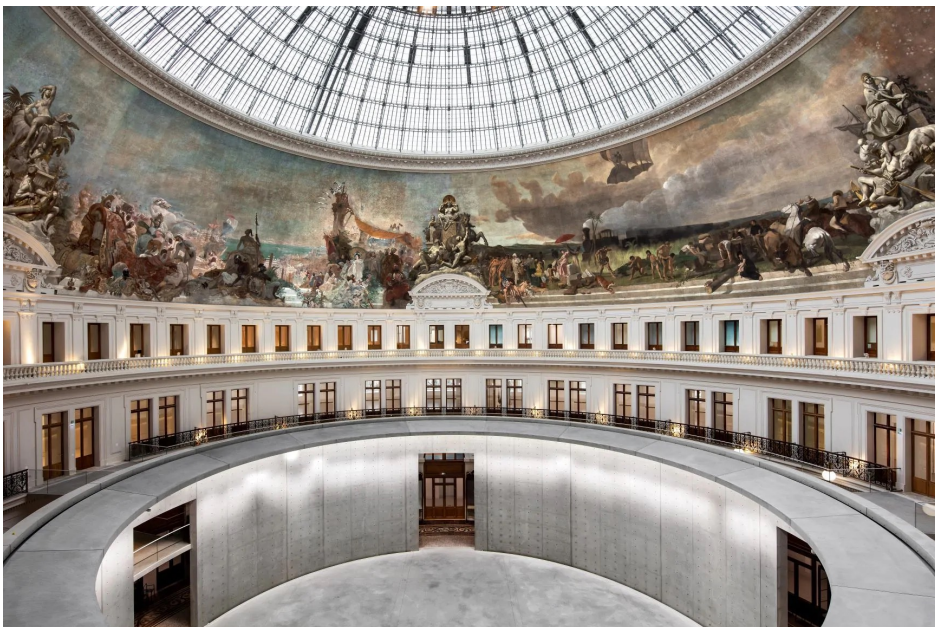
Les vingt-quatre vitrines du Passage de la Bourse de Commerce