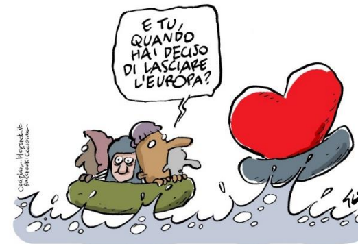
Gian Lorenzo Ingrami 2017

https://www.repubblica.it/ambiente/2020/02/05/foto/humor_biodegradabile_a_roma_mostra_vignette_su_inquinamento_plastica-247670599/1/?ref=search_11