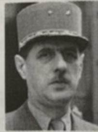
Charles De Gaulle Chef de la Résistance extérieure puis de la France résistante. (Biographie, p. 100)