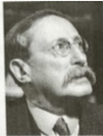
Léon Blum Chef du gouvernement sous le Front populaire (1936-1938). (Chronologie du Front populaire, p. 58)