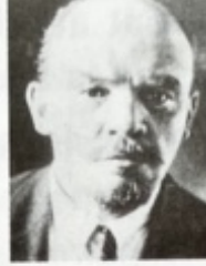
Lenine Dirigeant de la Russie soviétique de 1917 à 1924.