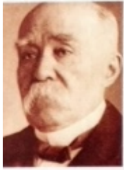
Georges Clemenceau Président du Conseil français de 1917 à 1920.