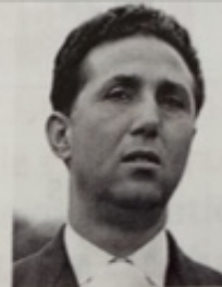
Ben Bella Président de la République algérienne (1963).