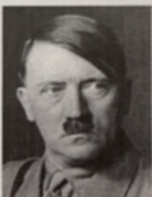
Adolf Hitler Dirigeant de l'Allemagne nazie de 1933 à 1945.