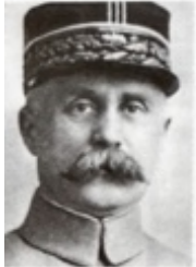
Maréchal Foch Commandant en chef des forces alliées sur le front de l'Ouest en 1918.