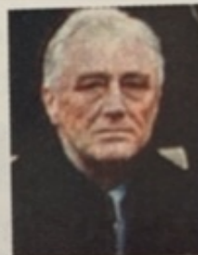
Franklin Roosevelt Président des États-Unis de 1933 à 1945.