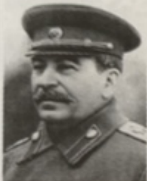
Joseph Staline Dirigeant de l'URSS de 1924 à 1953.