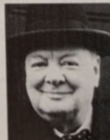
Winston Churchill Premier ministre du Royaume-Uni de 1940 à 1945.