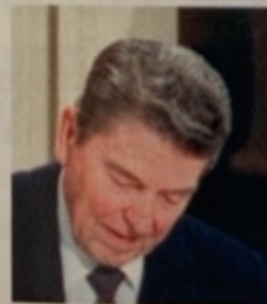
Ronald Reagan Président des États-Unis de 1981 à 1989.