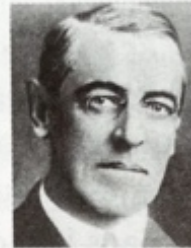
Woodrow Wilson Président des États-Unis de 1912 à 1920.