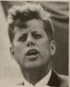
John F. Kennedy Président des États-Unis de 1961 à 1963.