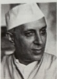
Nehru Leader indépendantiste indien (dirigeant du parti du Congrès) puis Premier ministre de l'Union indienne (1947-1964).