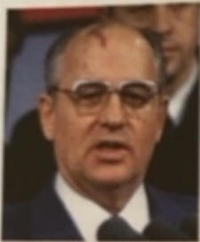
Mikhaïl Gorbatchev Dirigeant de l'URSS de 1985 à 1991.