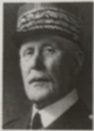
Philippe Pétain Chef de l'État français de 1940 à 1944. (Le régime de Vichy, p. 98)