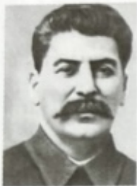
Joseph Staline Dirigeant de l'URSS de 1924 à 1953. (Biographie, p. 48)