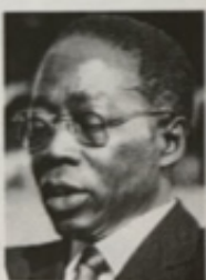
Senghor Président de la République du Sénégal (1960).