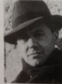
Jean Moulin Unifie la Résistance intérieure au nom de De Gaulle

Chef du gouvernement de Philippe Pétain.