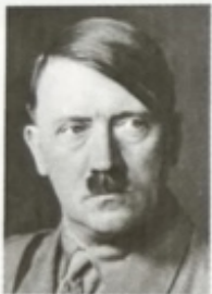
Adolf Hitler Chancelier de l'Allemagne en 1933, puis dictateur de l'Allemagne nazie (1933-1945). (Biographie, p. 50)