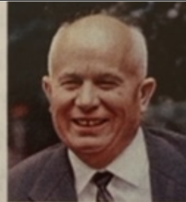
Nikita Khrouchtchev Dirigeant de l'URSS de 1953 à 1964.