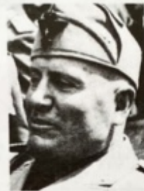
Benito Mussolini Dirigeant de l'Italie fasciste de 1922 à 1945.