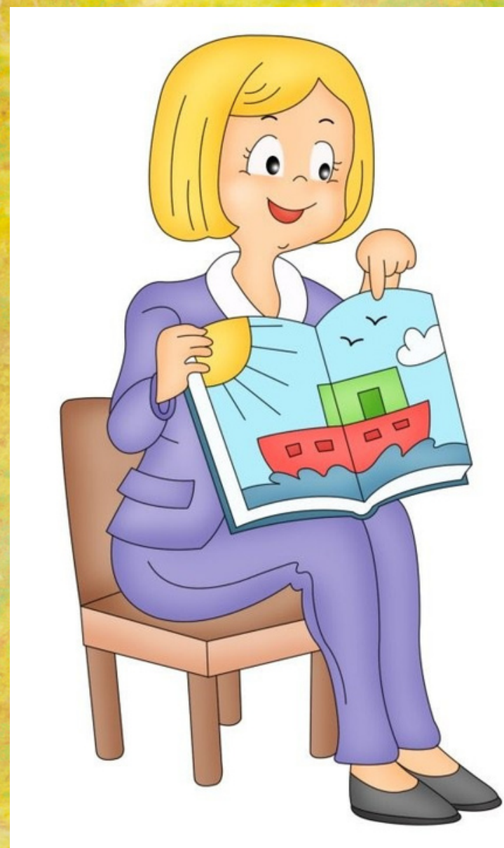
Педагог для детей