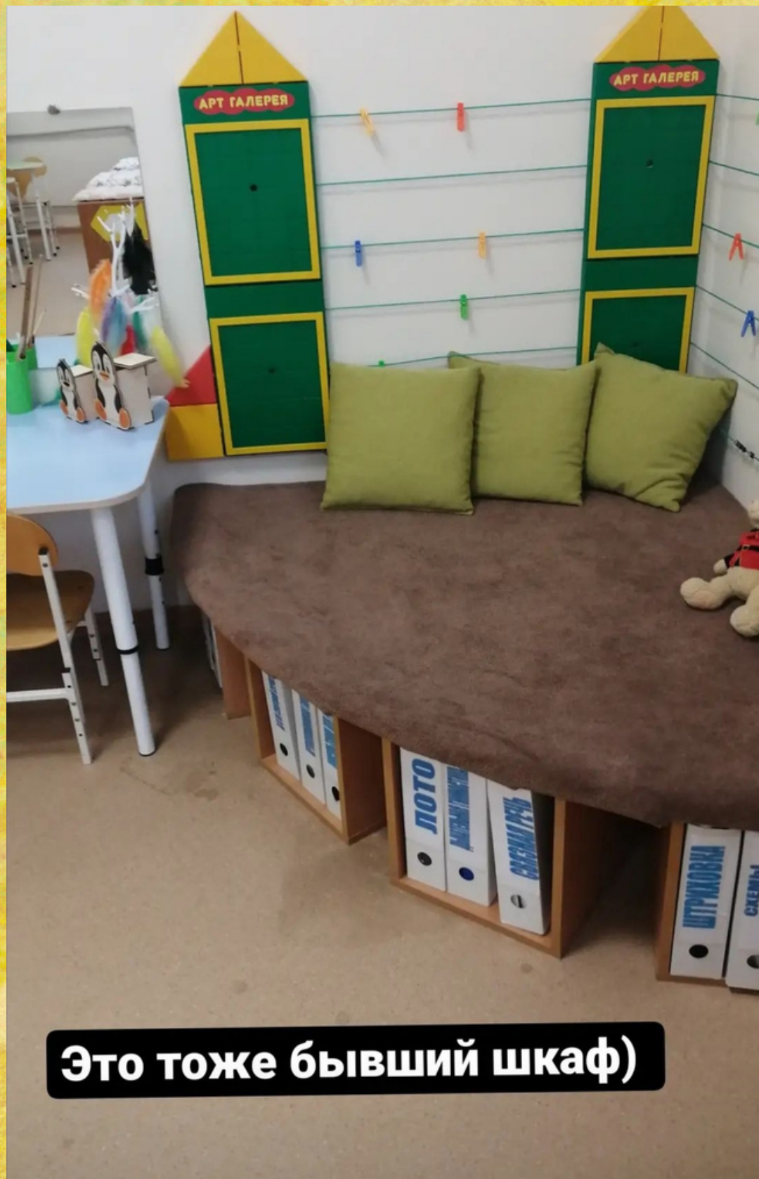
Это тоже бывший шкаф)