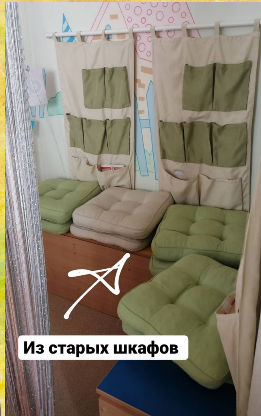
Из старых шкафов