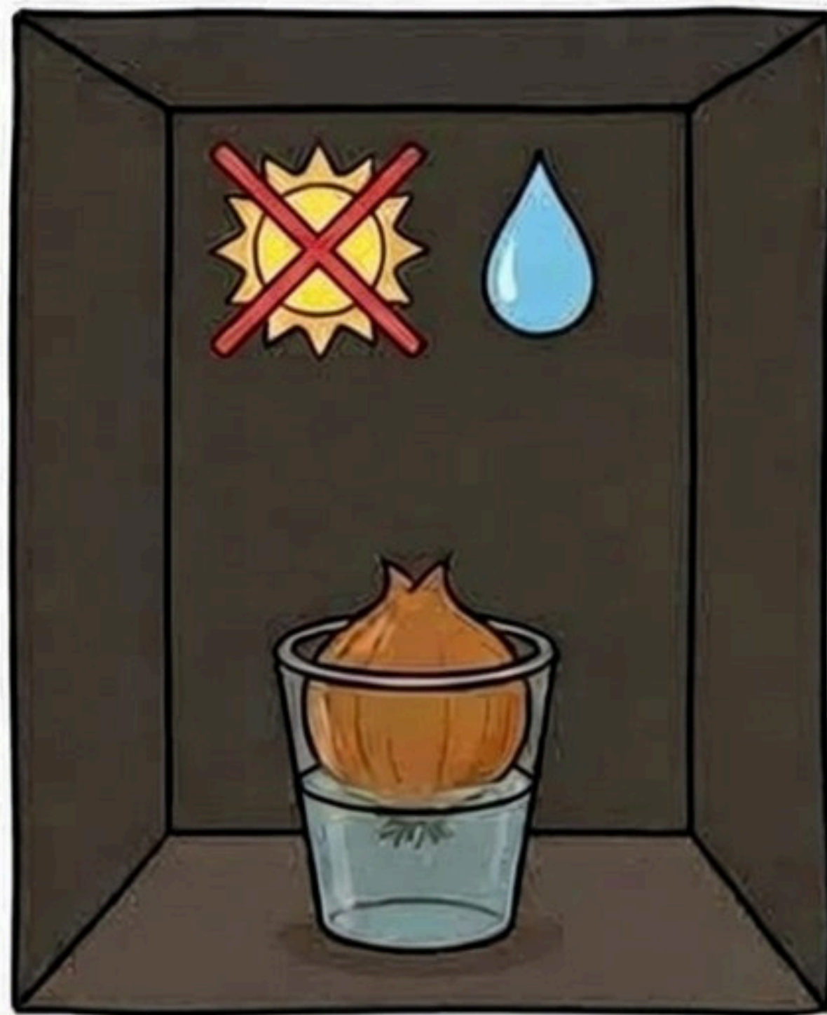
2. ТЕМНОТА + ВОДА