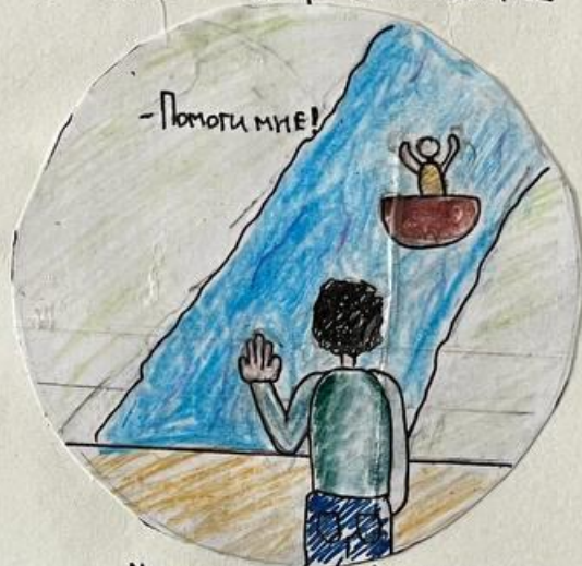
Меннерс тонет. Понгрек из-за злобы на него за жену не помог