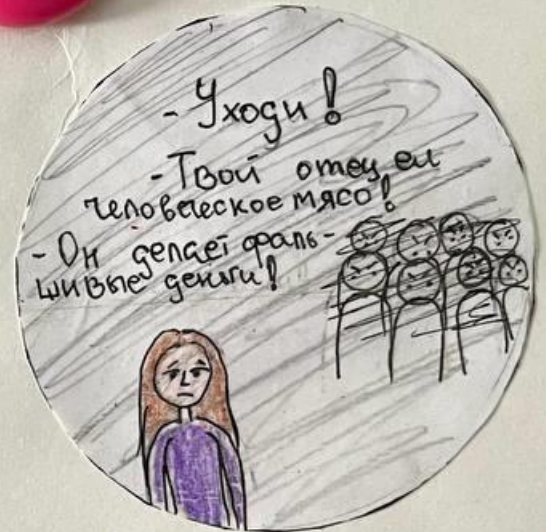
Ассоль некаждый день