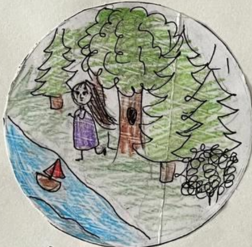
Ассоль бежит по лесу за корабльником