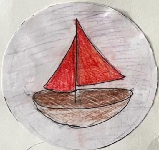
Понгрек подарил дочери корабль с алыми парусами