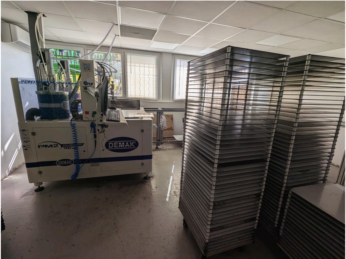
Salle de dôming