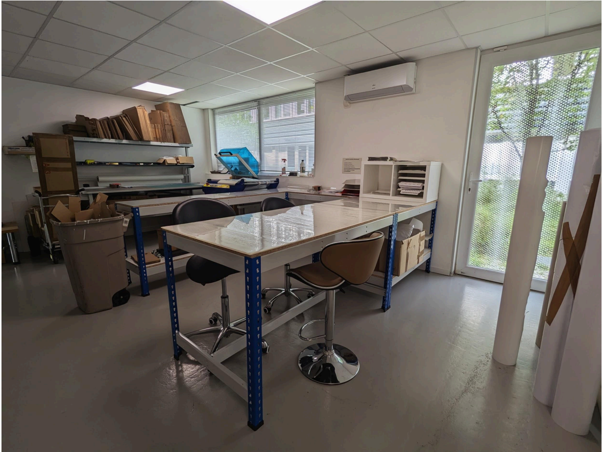
La salle de vérification et d'emballage