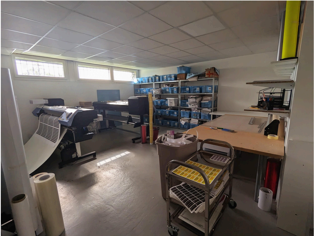
La salle d'imprimerie