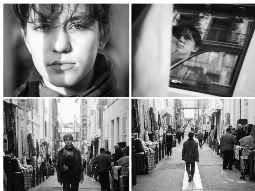
Belsunce, 1 er arr

Je me suis aperçu que là-bas les paysages étaient différents, les gens étaient différents, leur regard transmettait un message différent. La vie n'était pas facile et les règles plus les mêmes. J'étais de plus en plus intrigué par cette réalité, et ma curiosité ne cessait d'augmenter... jusqu'au jour où je me suis vu dans la même condition.