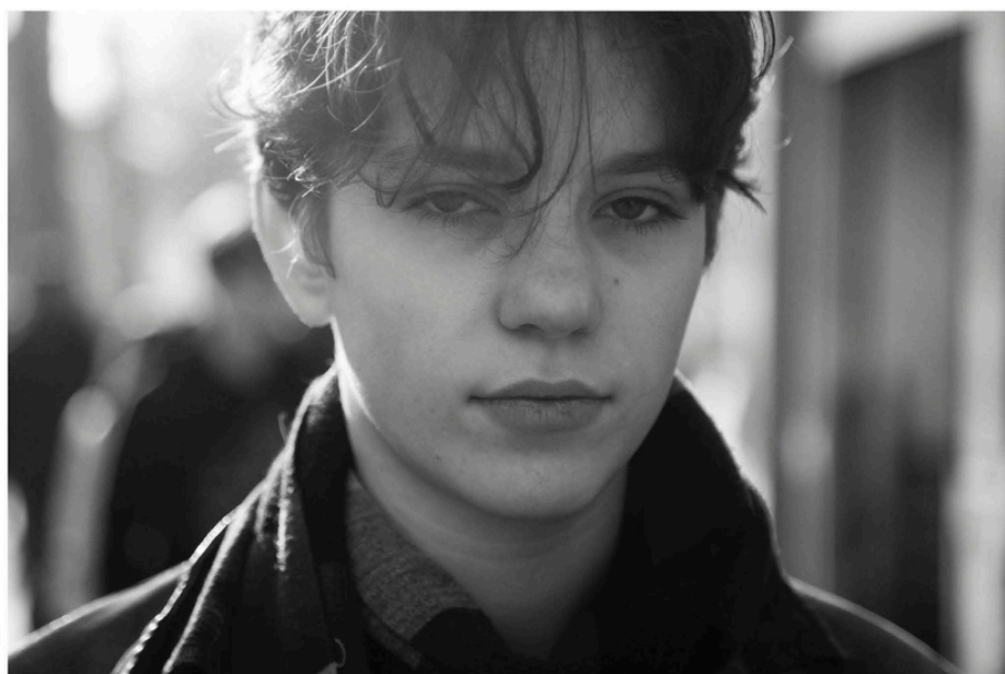
HAZEL 19 mars 2022

J'ai toujours été intrigué par le mélange culturel et les écarts de classes sociales en France. Jamais en Europe auparavant, je n'avais été confronté à la réalité des quartiers aussi sensibles comme les cités. J'ai commencé donc à écrire un documentaire et je me suis rapproché un tout petit peu de ces endroits secrets.