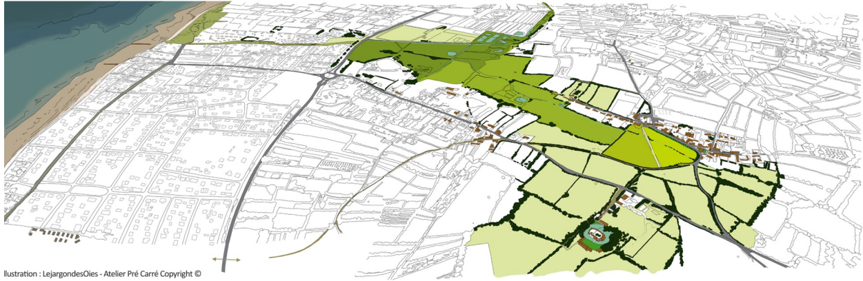
Illustration : LejargondesOies - Atelier Prê Carré Copyright ©