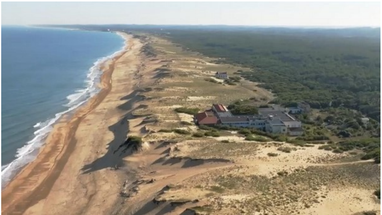
Figure 1: Vue aérienne de l'ancien centre Hélio marin de Labenne.