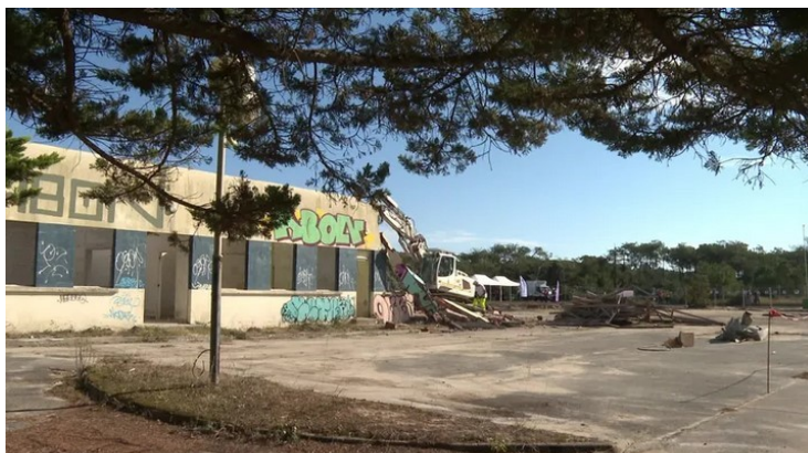
Le bâtiment est désaffecté depuis 2007.

Crédits Conservatoire – 1,28 millions € (AFITF) Europe (FEDER) - 400 000 € Agence de l'Eau Adour-Garonne - 210 000 € Région Nouvelle-Aquitaine - 800 000 € Département des Landes - 379 000 € CCMACS - 50 000 € Commune - 29 000 €