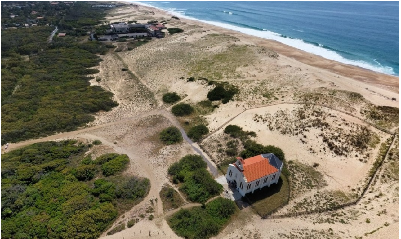
Figure 2: Vue aérienne de l'ancien centre Hélio marin depuis la Chapelle Sainte-Thérèse.