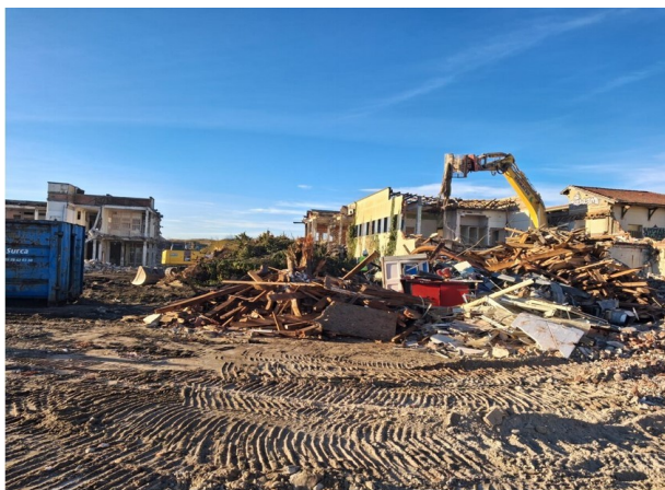
Chantier de déconstruction de l'institut hélio-marine en janvier 2026.

L'IHM, est un bâtiment construit dans les années 1930 comme sanatorium, pour offrir aux malades les bienfaits du soleil et de l'air marin. Il a fonctionné comme maison de retraite jusqu'en 2007, puis a été abandonné, dégradé, rongé par le sel et l'amiante. Selon les projections de l'Observatoire de la Côte Nouvelle-Aquitaine, sa position à 67 mètres de l'océan correspond au trait de côte attendu à l'horizon 2040. Sans intervention, les ruines auraient fini dans l'eau, emportant avec elles 250 tonnes d'amiante.