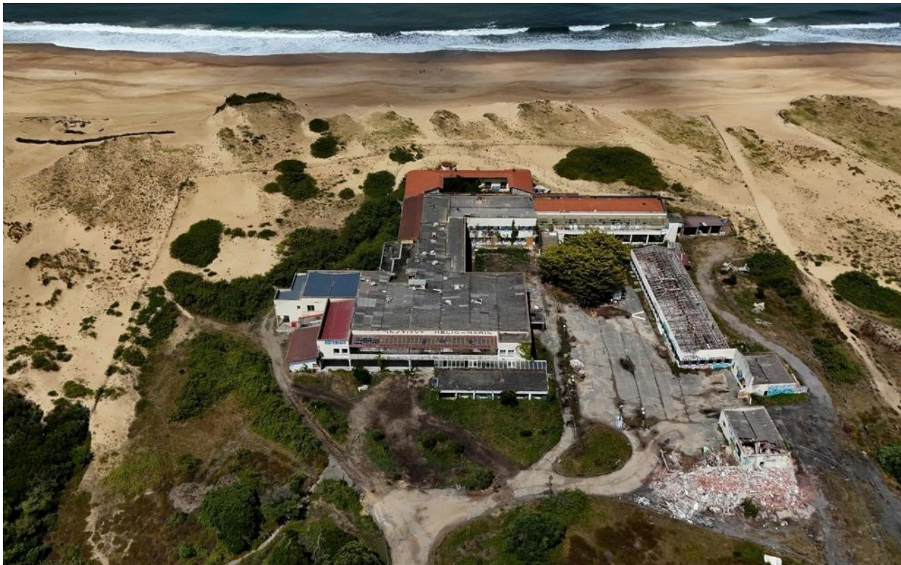
Vue aérienne de l'ancien Institut Hélio-Marine de Labenne, face à l'océan le 24 juillet 2025.