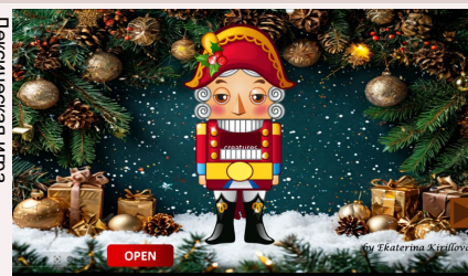
Лексическая игра "Nutcracker"

Применение игровых технологий на уроках повышает мотивацию обучающихся, а также создаёт условия для совершенствования лексических и грамматических навыков и развития умения говорения у обучающихся среднего звена общеобразовательной школы. Игра удовлетворяет потребность обучающихся среднего школьного возраста в общении со сверстниками.