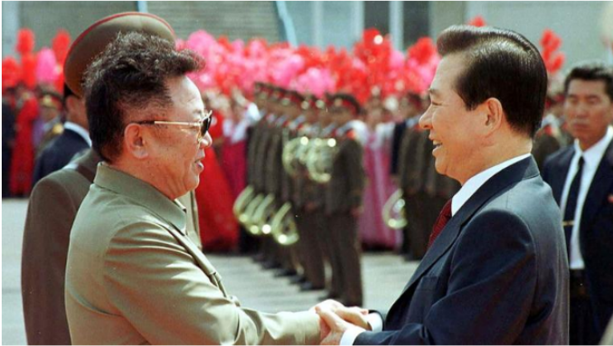
Premier sommet intercoréen en 2000 entre Kim Jong-il et Kim Dae-jung.

Le village de Panmunjon (identifié à l'arrêt des combats en 1953) est un véritable « lieu de mémoire », visité par de nombreux touristes sud-coréens.