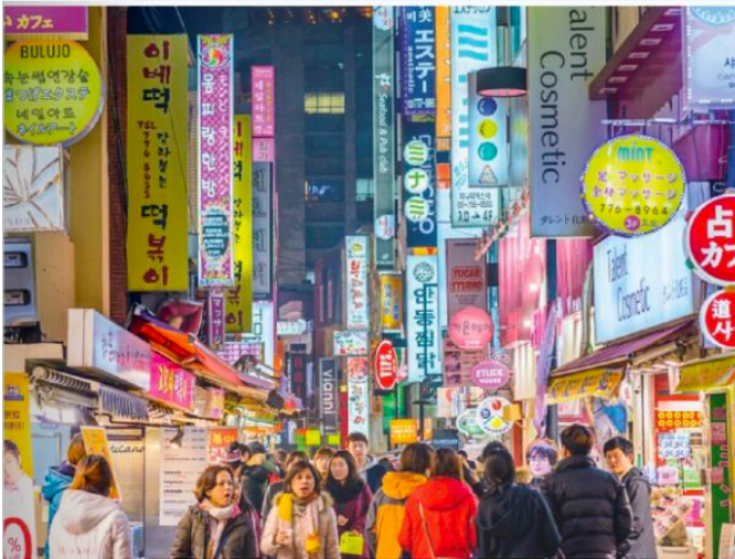
La capitale de Corée du Sud, Séoul en 2017.

Perspective monde, Université de Sherbrooke, 2017.