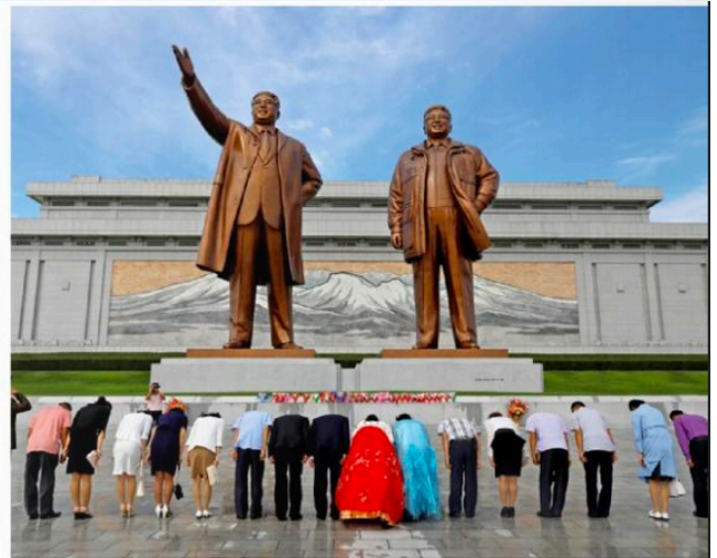
À Pyongyang, capitale de Corée du Nord, les statues de Kim Il-sung (mort en 1994, à gauche) et de son fils Kim Jong-il (mort en 2011).