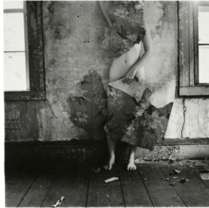
Francesca Woodman Space , 1975-1978 (à gauche) Space2 , 1976 (à droite)