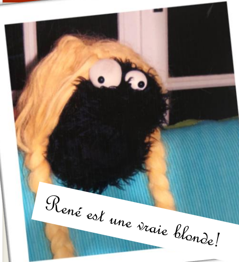
René est une vraie blonde!