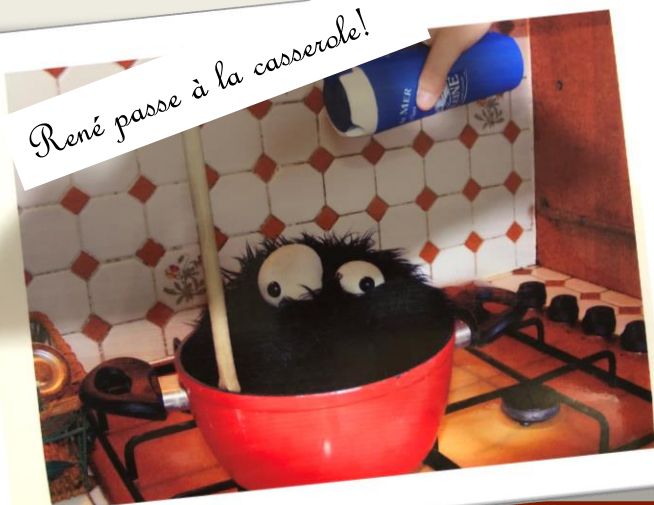
René passe à la casserole!