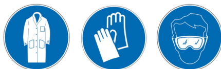
Pictogramme de prévention