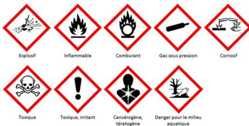
Pictogramme de danger