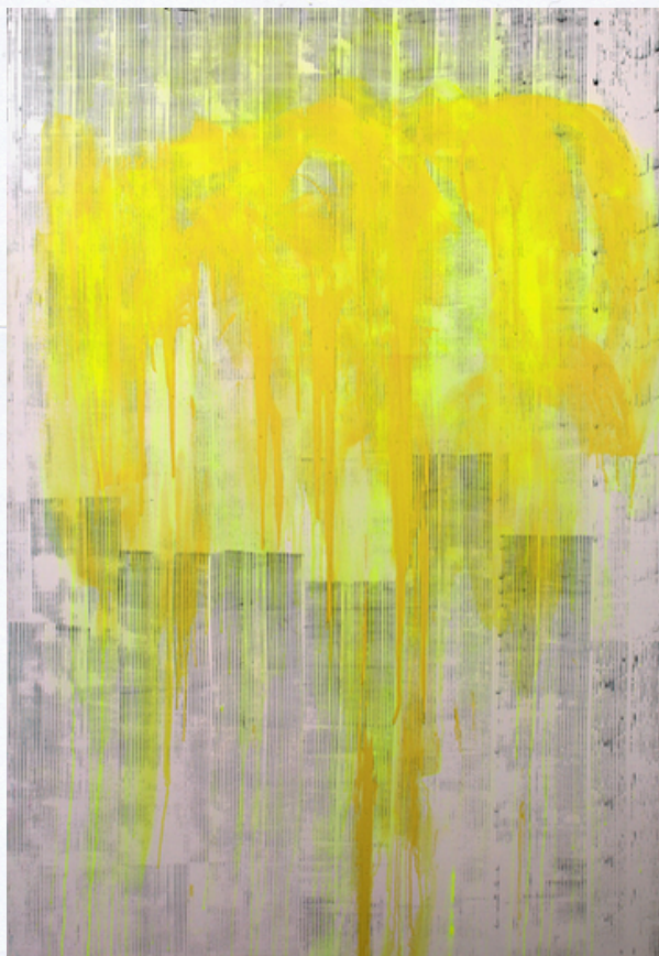
Nissrine Seffar ©