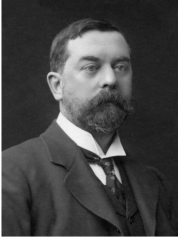
John Singer Sargent en 1903