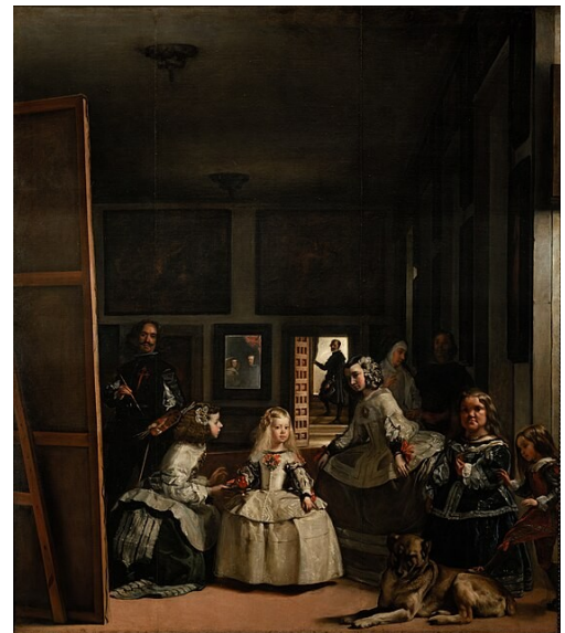
Les Ménines. Velasquez 1656