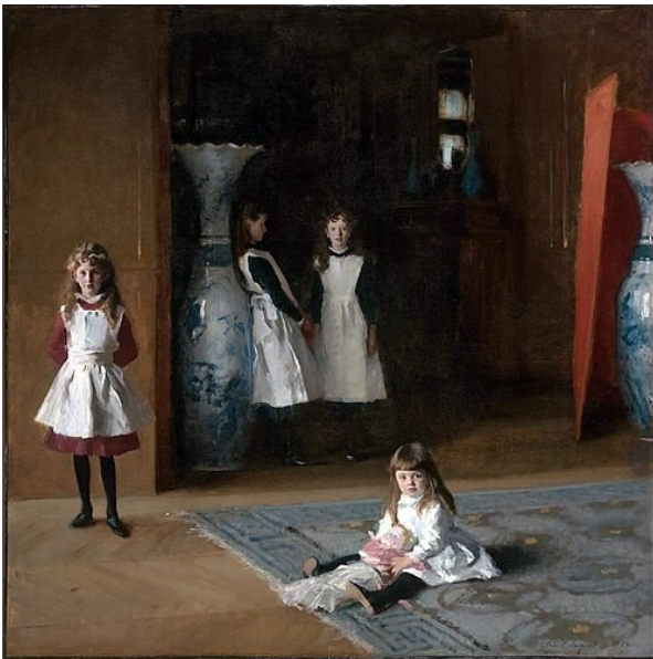
Les filles d'Edward Darley Boit. 1882