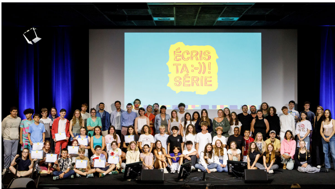
Les lauréats de la 4e édition d'Écris ta série ! au CNC le 3 juillet 2025