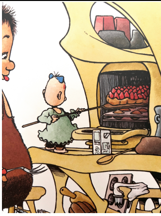
Une tarte aux fraises