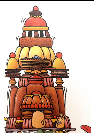
Un gâteau à neuf étages