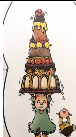
Un bon gâteau à sept étages