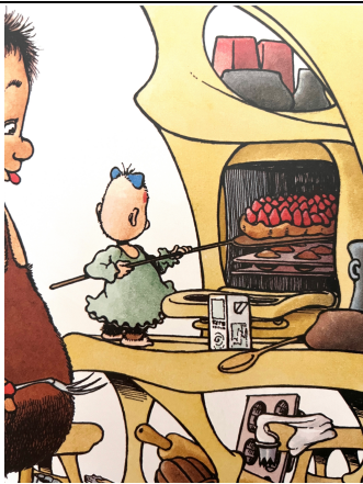
Une tarte aux fraises