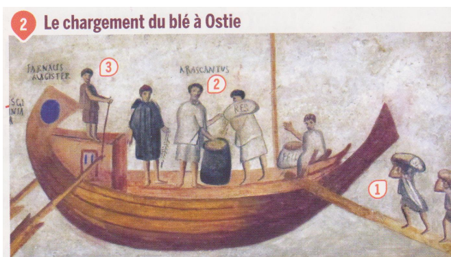
▲ Fresque de l'Isis Giminiata trouvée à Ostie, II e siècle après J.-C. (bibliothèque du Vatican).

Des porteurs chargent les sacs de grains (1), tandis qu'un magistrat de l'annone (l'administration des greniers publics à Rome) mesure le chargement (2) sous l'œil du capitaine du bateau (3). Le blé est ensuite acheminé sur le Tibre jusqu'à Rome et transformé en farine pour en faire du pain.