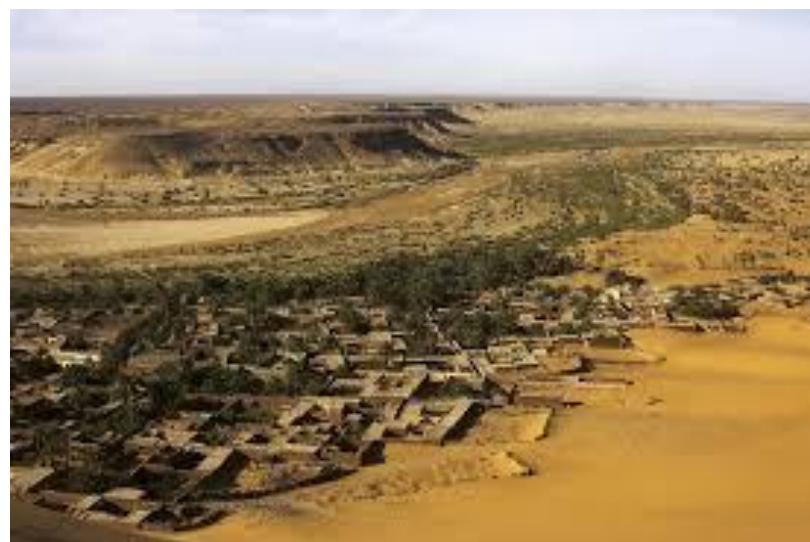
Document 3 : L'oasis de Béni Abbès (Sahara algérien)