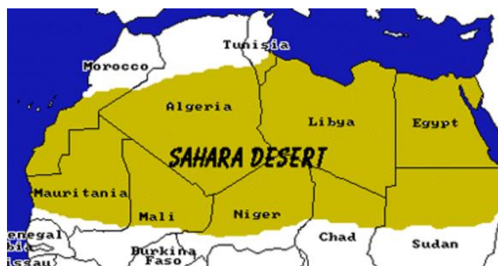
Document 1 : Le Sahara