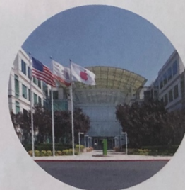
▲ Siège d'Apple, Cupertino (Californie).

VOC Une métropole : grande ville possédant de nombreuses fonctions dans les domaines politique, économique et culturel.