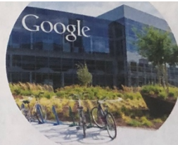
▲ Siège de Google, Mountain View (Californie).

D'après Michael Grunwald, « Why California is Still America's Future », Time magazine , 29 septembre 2009.