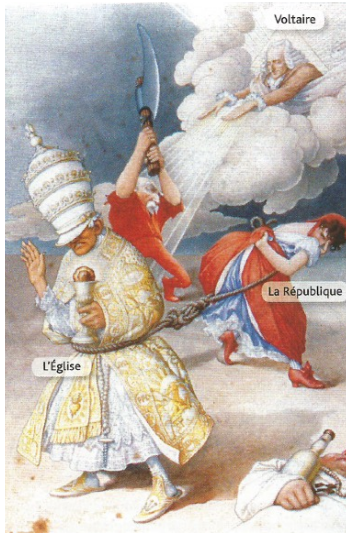
(Lithographie. Musée Jean Jaurès, Castres.)