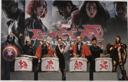
▼ Sortie du film Avengers 2 au Japon, juin 2015.

Les grandes compagnies américaines de divertissement, comme Disney, savent produire ce qui plaît à tout le monde [...]. À de rares exceptions près, comme Cuba ou la Corée du Nord, le cinéma et la musique américaines dominent, et finissent par diffuser des valeurs communes. Spider-Man , Le Roi Lion ou Avatar en sont des exemples. [...] Le monde entier est sous influence intellectuelle du soft power 1 américain, qui touche à la télévision, la musique et le cinéma.