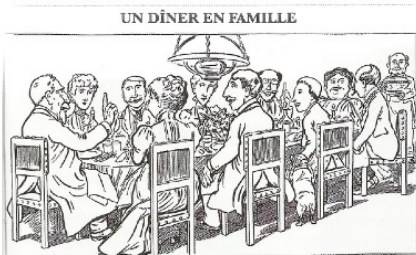
Surtout ! ne parlons pas de l'affaire Dreyfus !