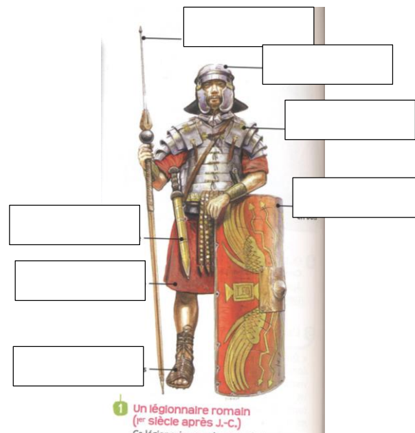
1 Un légionnaire romain (I er siècle après J.-C.) Ce légionnaire romain est...