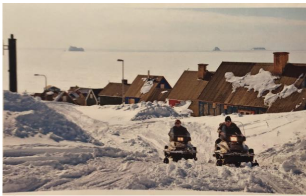
Document 3 : Se déplacer dans l'Arctique en hiver