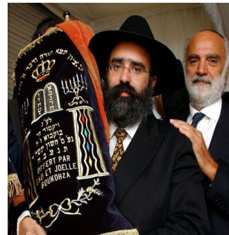
TITRE (tableau) : le judaïsme = la religion juive