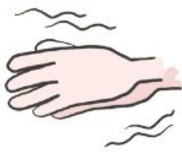
se frotter les mains