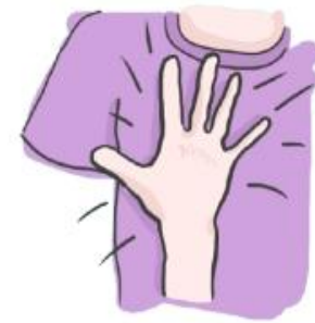
se frapper le torse