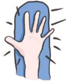
se frapper les cuisses