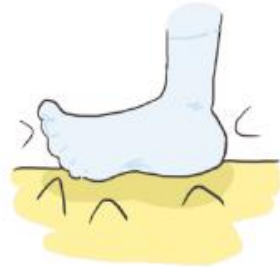
taper du pied