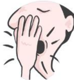
se frapper la bouche