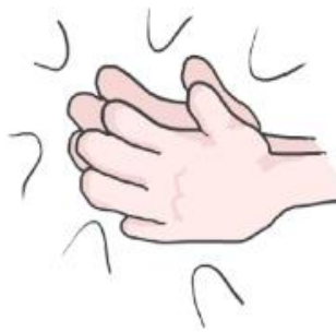
frapper dans les mains