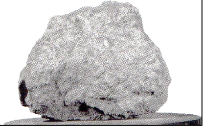
La roche lunaire 10057 à son arrivée sur Terre en 1969.

Parmi les roches lunaires rapportées lors du premier voyage sur la Lune, on trouve la roche 10057. Ce fragment lunaire a une masse de 919 g.