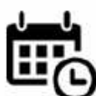
Gestion du temps