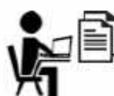
Revue de projet