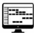
Gestion des tâches