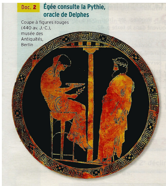
Doc. 2 Égée consulte la Pythie, oracle de Delphes

1) Où est le principal sanctuaire d'Apollon en Grèce ?