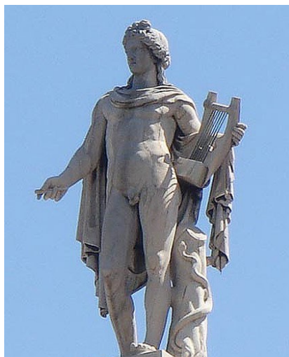
Doc. 3 L'autre de la Pythie

Le Mantéum ou siège de l'oracle 1 n'est autre chose, dit-on, qu'un antre, un trou profond, dont l'ouverture, d'ailleurs assez peu large, laisse échapper certaine vapeur qui porte à l'enthousiasme 2 . Cette ouverture est recouverte d'un trépied très élevé, au haut duquel la Pythie monte pour recevoir ces émanations 3 excitantes, et prononcer de là, soit en vers, soit en prose, les oracles que le dieu lui inspire : ceux qu'elle dit en simple prose sont immédiatement traduits en vers par des poètes attachés au service du temple.