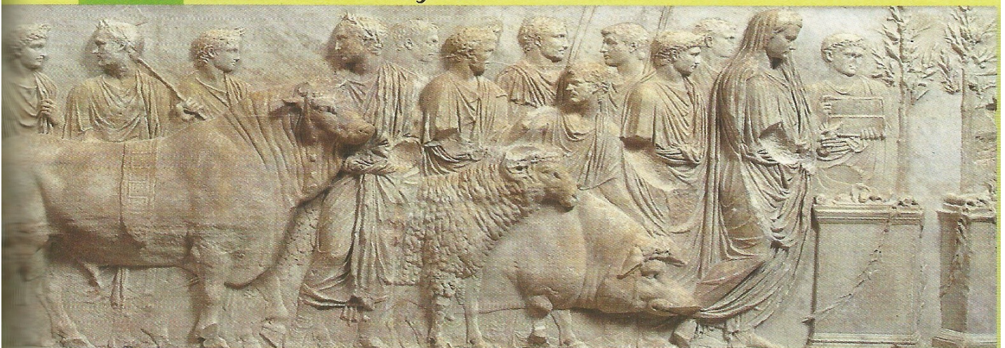
Bas-relief, sarcophage romain (vers 15), musée du Louvre, Paris