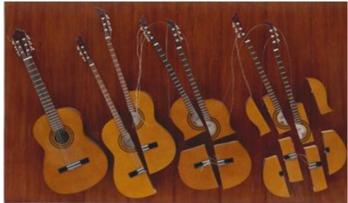
Pablo Picasso : « Guitare ». Carton découpé, fil. 1912. Arman : « Guitares , fragmentation ». Fragmentation de guitares sur bois. 2000.