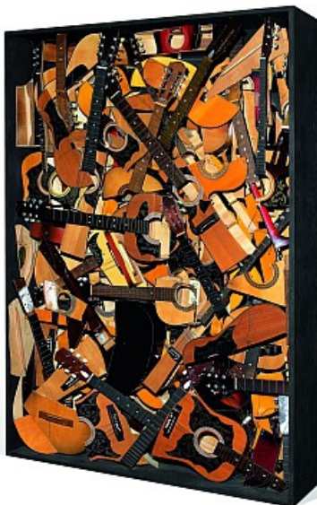
Arman : « Hommage au cubisme ». Accumulation de guitares découpées dans une boîte en bois. 1983.