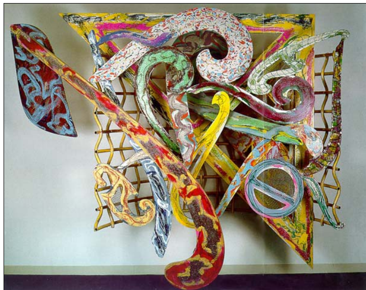
Frank Stella : « Jungli-Kowwa ». Peinture sur aluminium découpé. 1978. ( cette image devra vous permettre de créer une oeuvre représentant un morceau de musique créé avec votre guitare ).