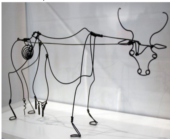
« vache »