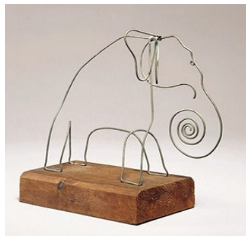
Alexander Calder - Elephant Wire and wood, 1928