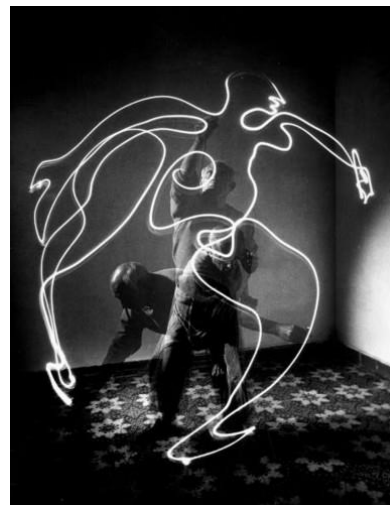
Les « dessins de lumière » de Pablo PICASSO. Photographies de Gjon MIL – 1949