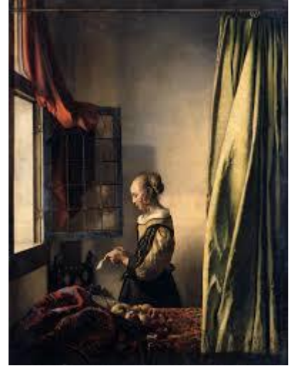
Johannes VERMEER La liseuse à la fenêtre , 1657