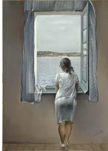
Salvador DALÍ Jeune fille à la fenêtre , 1925