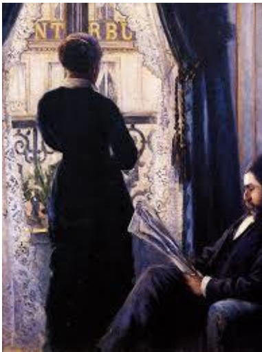
Gustave CAILLEBOTE Intérieur, femme à la fenêtre , 1880