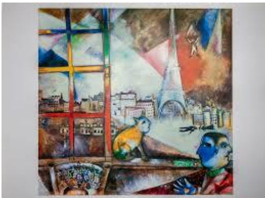
Marc CHAGALL – Paris par la fenêtre , 1913