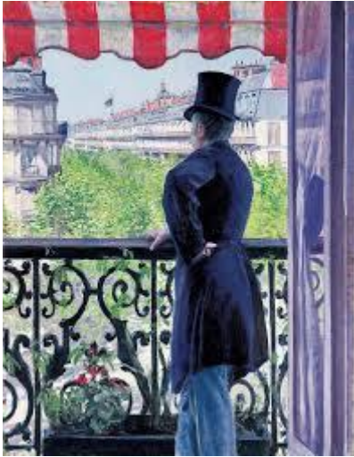
Gustave CAILLEBOTE Homme au balcon , 1880