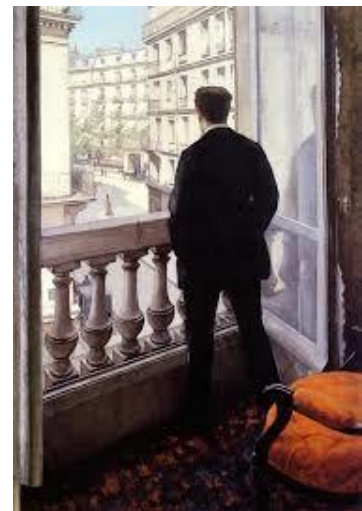
Gustave CAILLEBOTTE Jeune homme à sa fenêtre , 1875