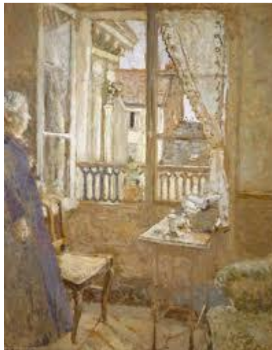
Edouard VUILLARD La fenêtre ouverte , 1903