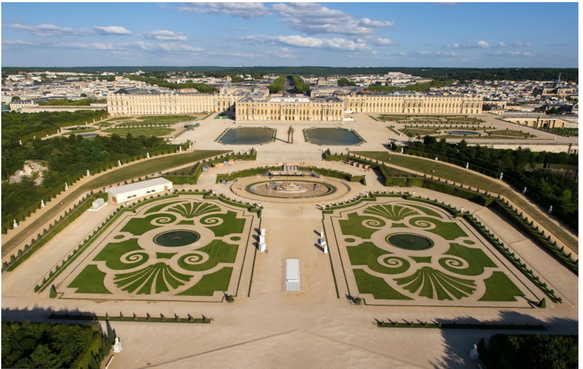
Doc. 15. a. Vue du château de Versailles depuis l'Ouest