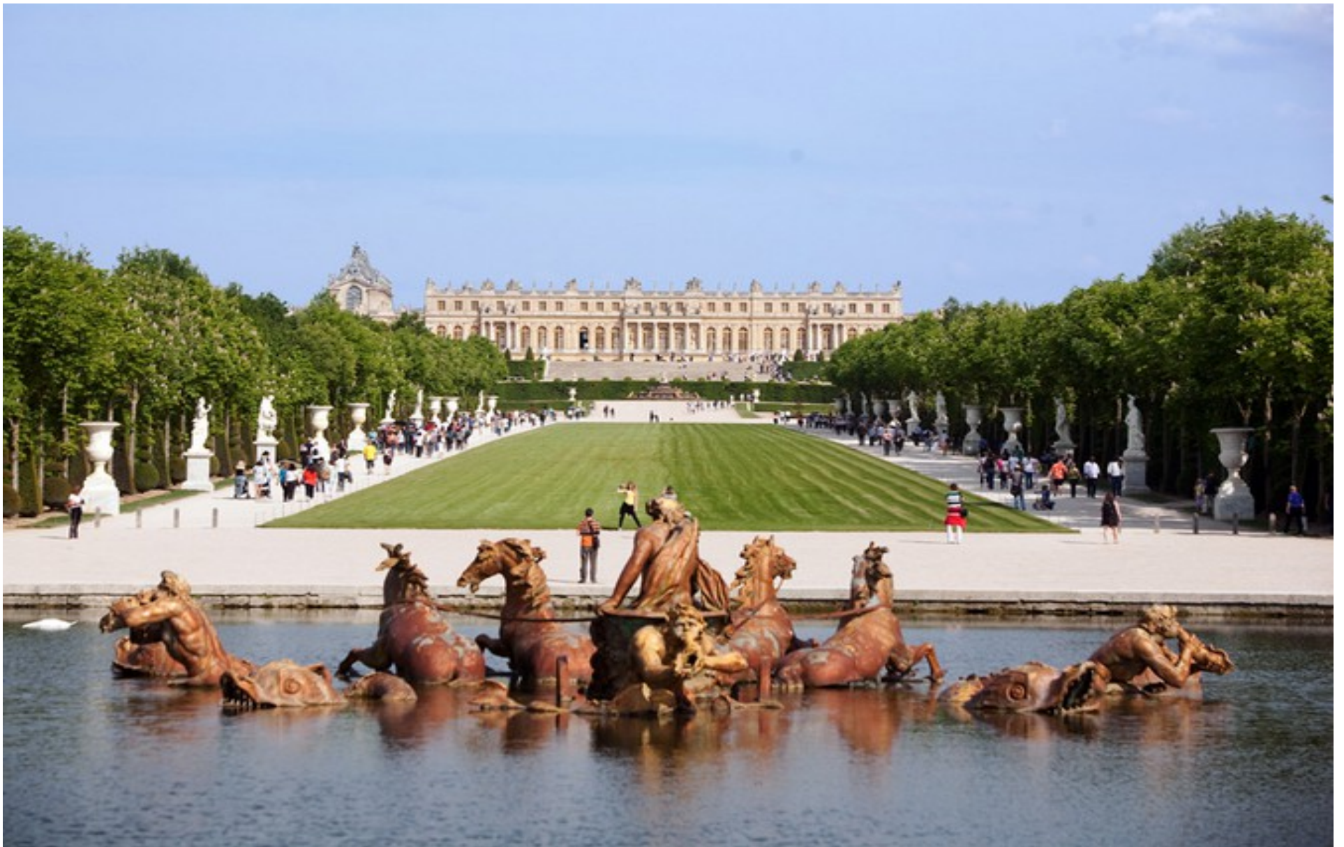
Doc. 15. b Bassin d'Apollon dans les jardins du château