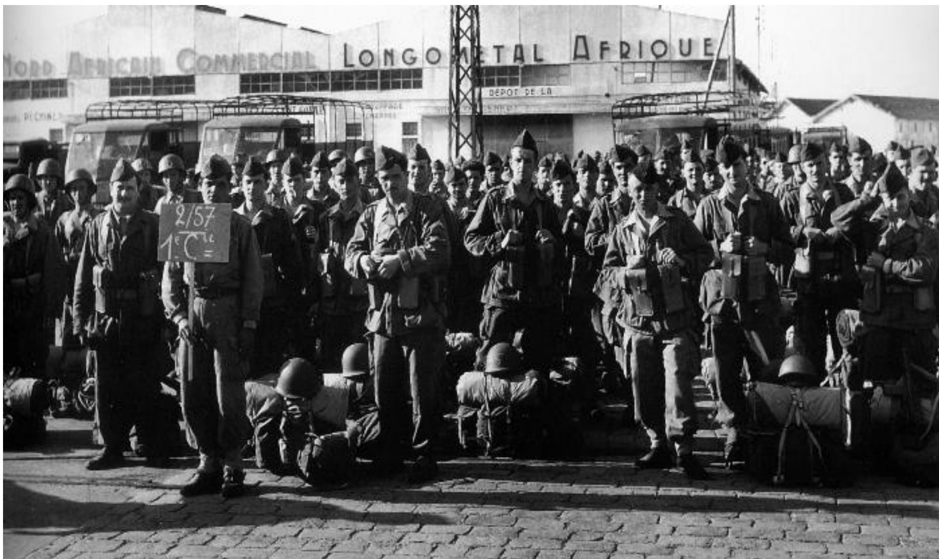
Doc. 6. Faire son service militaire (des appelés pour la guerre d'Algérie) : un lien fort entre l'armée et la nation