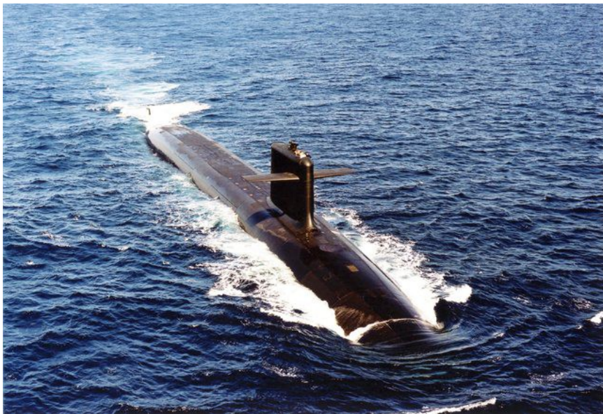
Un sous-marin nucléaire français lanceur d'engins (SNLE)