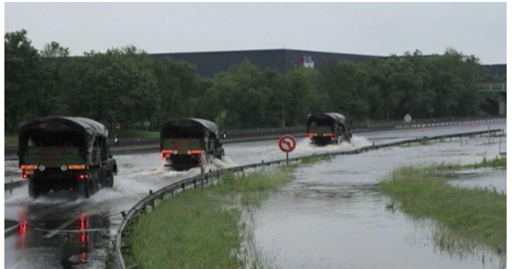
Intervention de l'armée pour exfiltrer les populations prises au piège par les inondations sur l'A10 en 2016