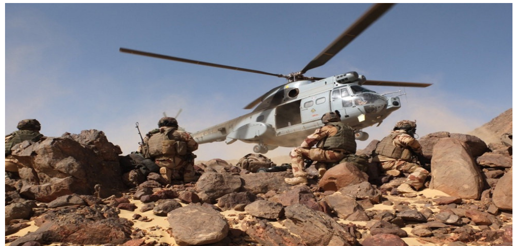
L'opération Barkhane : La France intervient au Mali en 2013

Doc. 1. Quelles sont les différentes missions de la Défense nationale ?