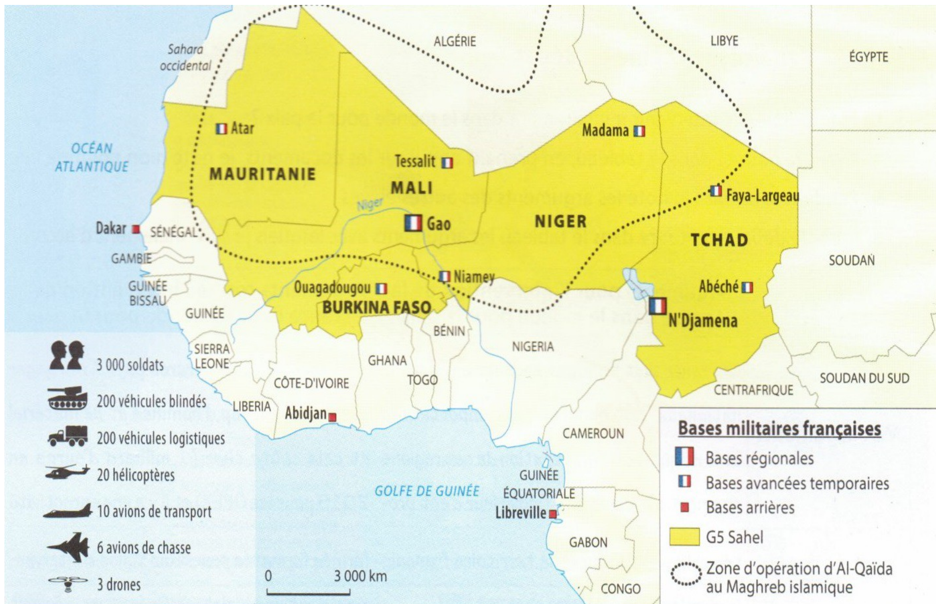
Doc. 7. Un engagement de la France à l'étranger : le Sahel