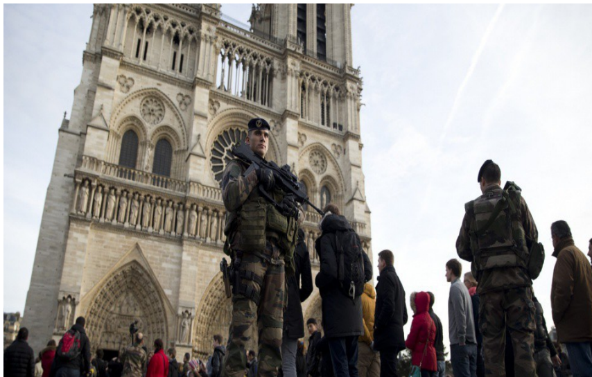
Un soldat de l'opération Sentinelle