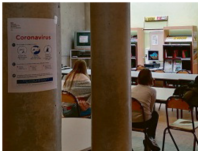
Information sur les gestes contre le coronavirus, affichée dans un collège.

Signes. « Selon les premières observations, ce virus cause peu ou pas de symptômes chez les enfants. Certains risquent donc d'être porteurs du virus sans le savoir. Et, même s'ils ne sont pas malades, ils risquent de le transmettre à d'autres. »