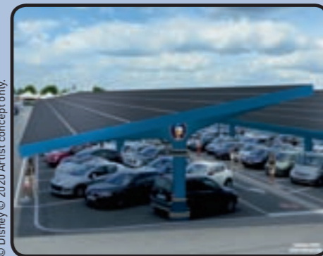
© Disney © 2020 Artist concept only.