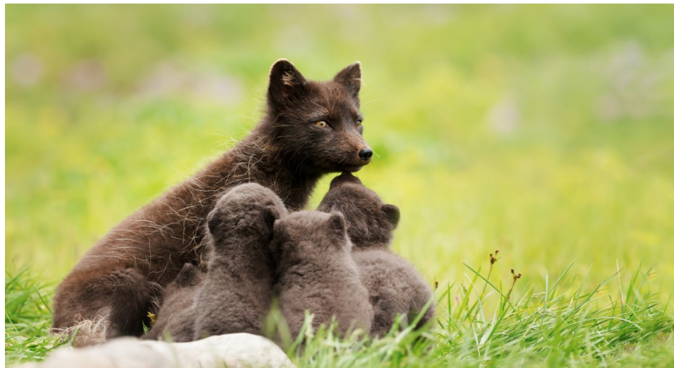
RENARD POLAIRE BRUN ETE