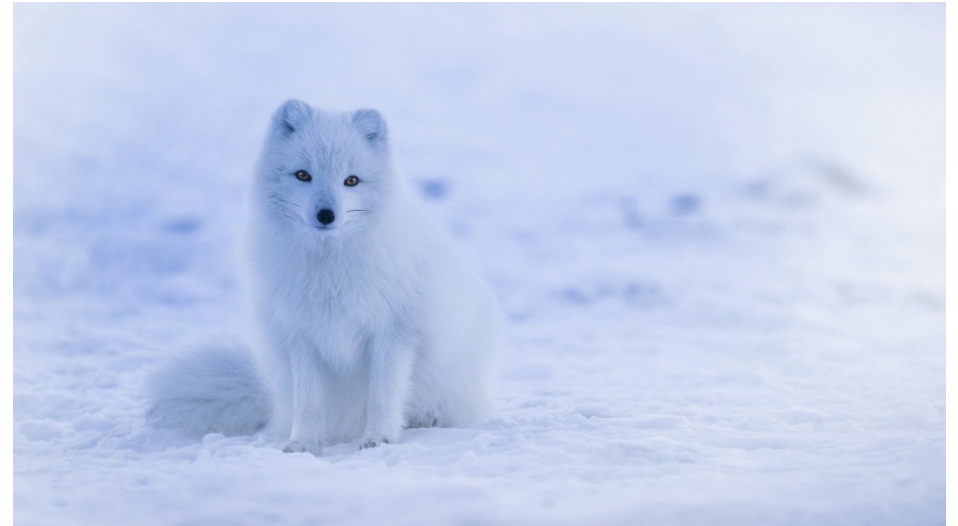
RENARD POLAIRE BLANC HIVER