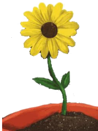
UNE FLEUR une fleur