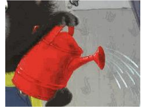
UN ARROSOIR un arrosoir