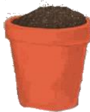
UN POT un pot