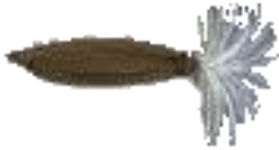
UNE GRAINE une graine