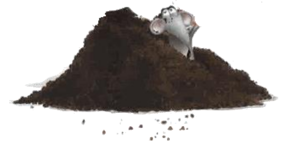
LA TERRE la terre