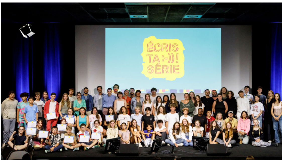
Les lauréats de la 4e édition d'Écris ta série ! au CNC le 3 juillet 2025